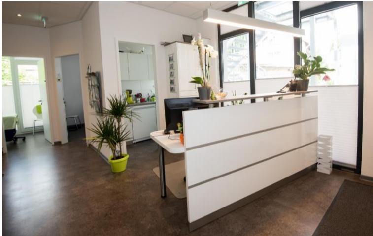
Physio-, Ergo-Therapie, Logopädie und Pflegedienste