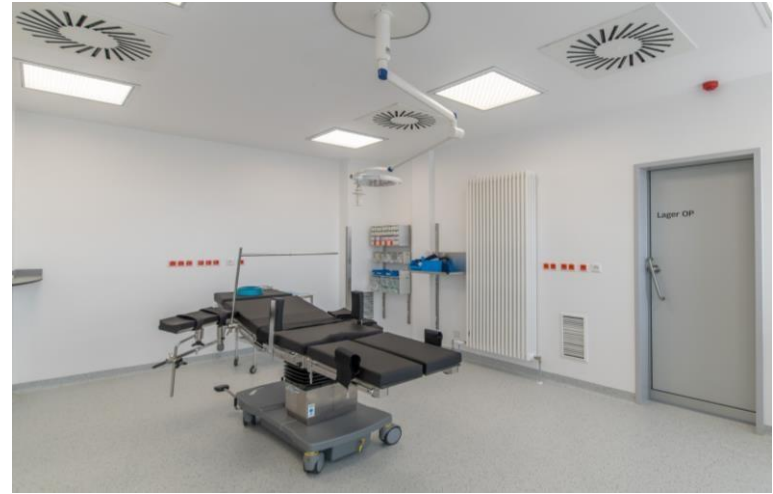
Ambulante OPs und OP-Zentren