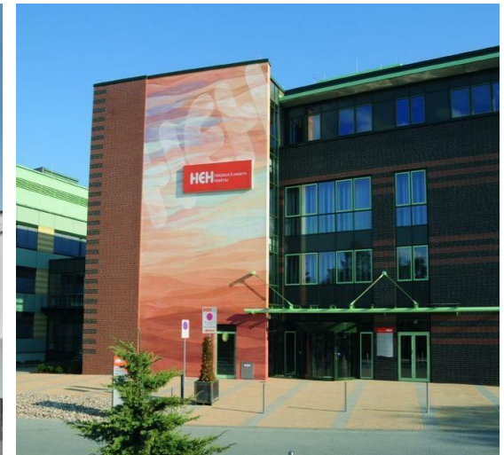
Ärzte- u. Ambulanzzentrum HEH